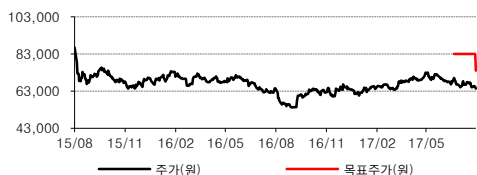
주가와 목표주가의 추이